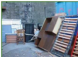
Voluminosos i trastos vells a la deixalleria d'Escaldes-Engordany.

Els trastos vells i residus voluminosos, com mobles, matalassos, electrodomèstics espatllats, etc., estan fets de materials molt diversos que es poden recuperar o valoritzar i requereixen, per tant, una recollida específica. Per garantir que se'n faci la gestió més adequada, cal portar-los a la deixalleria, ja que actualment no hi ha centres de recuperació específics. Les deixalleries també tenen la funció d'evitar que els trastos s'abandonin al carrer o es llencin en abocadors incontrolats, amb els problemes per als ciutadans i els riscos ambientals que això comporta.